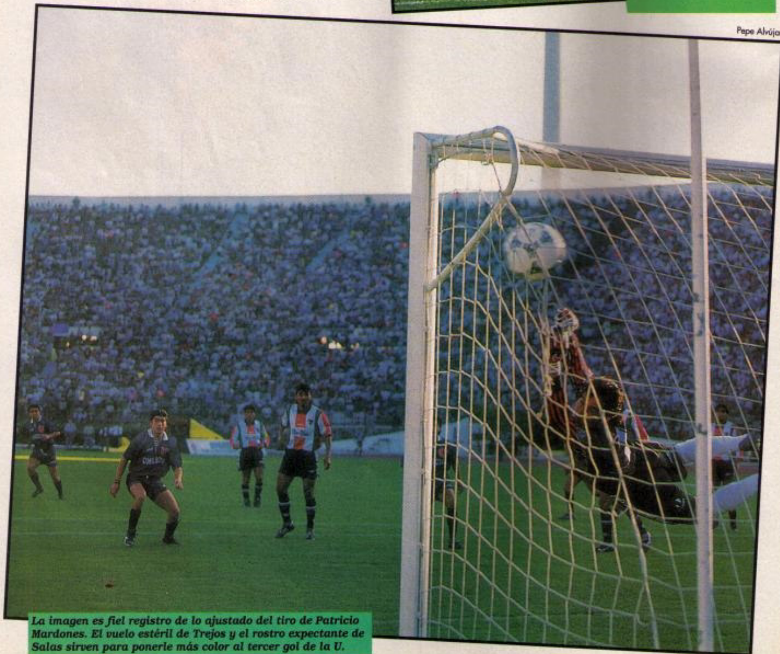
La imagen es fiel registro de lo ajustado del tiro de Patricio Mardones. El vuelo estéril de Trejos y el rostro expectante de Salas sirven para ponerle más color al tercer gol de la U.