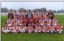
Divisiones Menores, en el Complejo de Cadetes

Esta es la apuesta para el futuro, la apuesta a que cada vez sean más los jugadores formados en casa que integren el primer equipo y menos los que se contraten, hasta llegar a ser una real potencia deportiva.