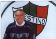
Héctor Silva, Alcalde de La Cisterna, siempre junto al Club

Debe aportar en todos los ámbitos que estén a su alcance. Lógicamente lo primordial es lo deportivo, pero puede ayudar por ejemplo en apoyo médico, aprovechando los buenos elementos con que cuenta en su cuerpo técnico. Ese tipo de cosas le daría más identidad con la gente de la comuna