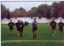
El trabajo físico, pilar de las divisiones menores

Palestino va por ese camino, ya que gracias a un trabajo serio y responsable, en donde el azar juega un papel secundario, y la planificación y cumplimiento de metas son sus bases, se ha logrado a través de estos últimos años engrandecer a la Institución y comenzar a aportar al medio.