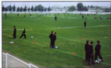
La gran infraestructura de cedeles, nos permite trabajar satisfactoriamente

La globalización del medio, hace que la actividad se torne más exigente, y los destacados serán quienes aprovechen de mejor manera sus recursos intelectuales, físicos y de infraestructura.