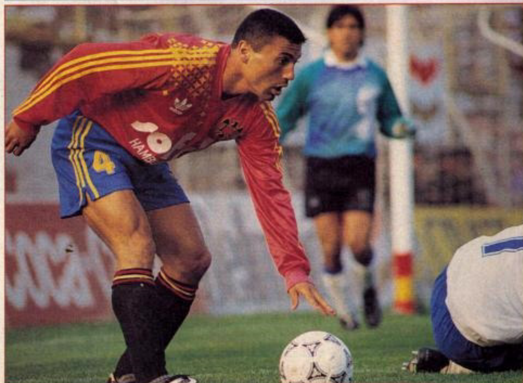
El defensor luce la camiseta de Unión Española. Con los rojos, el nortino vivió la mejor campaña de su vida al llegar a cuartos de final de Copa Libertadores '94.

Ver grandes a mis hijos y que sean personas de bien para la sociedad. •