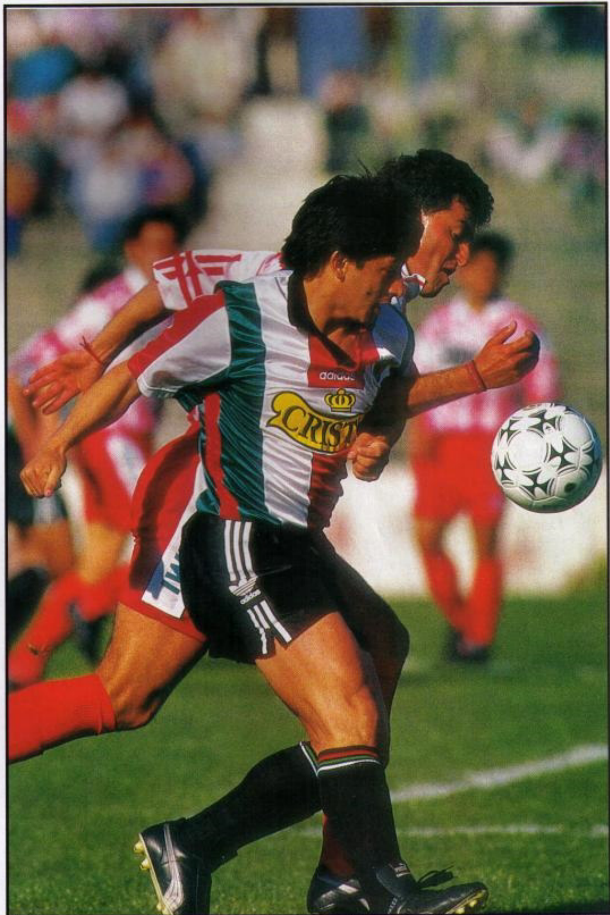
El abrazo con un compañero de Palestino tras la conquista de un gol. Una imagen a la que los hinchas tricolores se han habituado con el Tunga.

Copa Interamericana y Recopa en Colo Colo (1992); Copa Concacaf por Monterrey (1994).