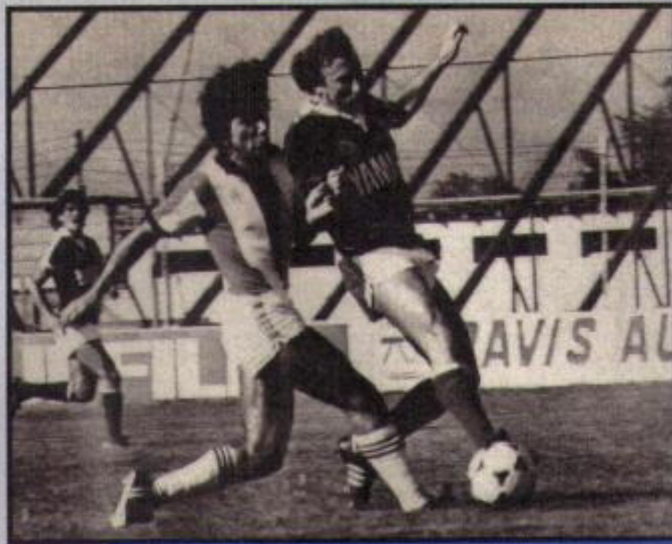
En 1984, cuando defendía la divisa de Audax Italiano, jugando contra Palestino, su club de origen. Su hijo del mismo nombre, actualmente en México, también se inició en el club árabe.